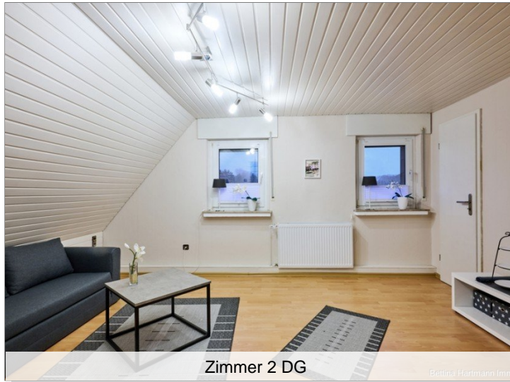
Zimmer 2 DG