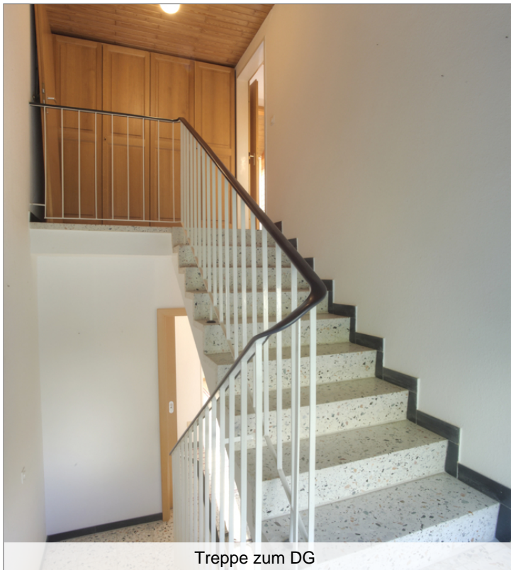
Treppe zum DG