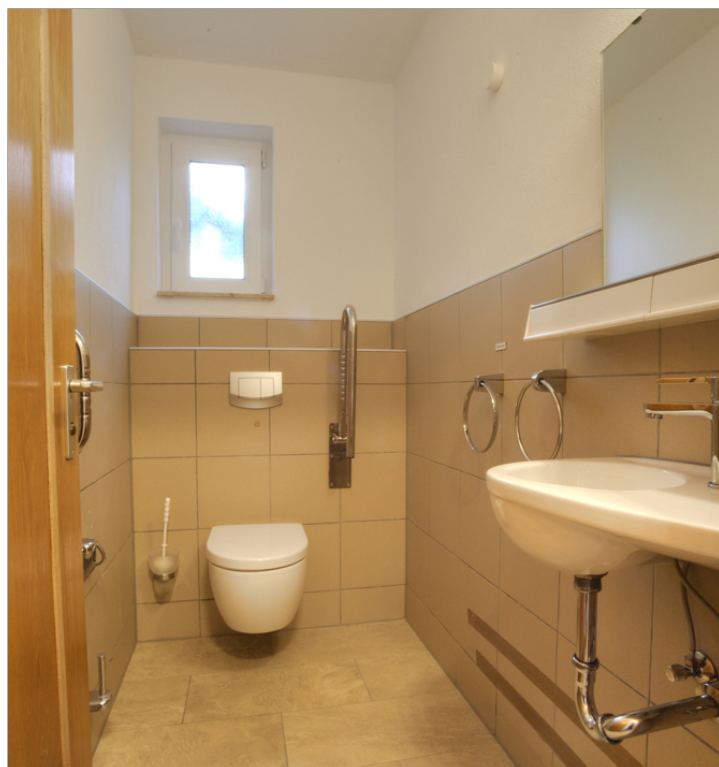
Gäste WC EG