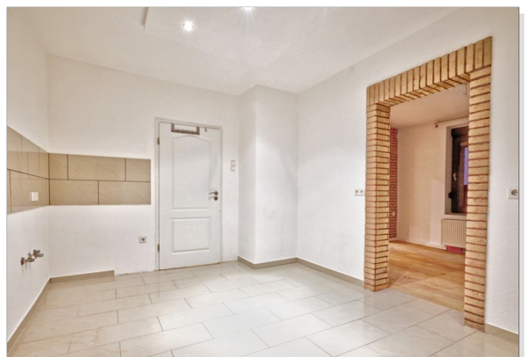
Küche EG links