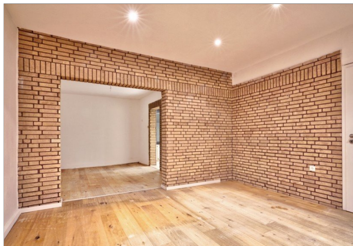
Wohnen EG links