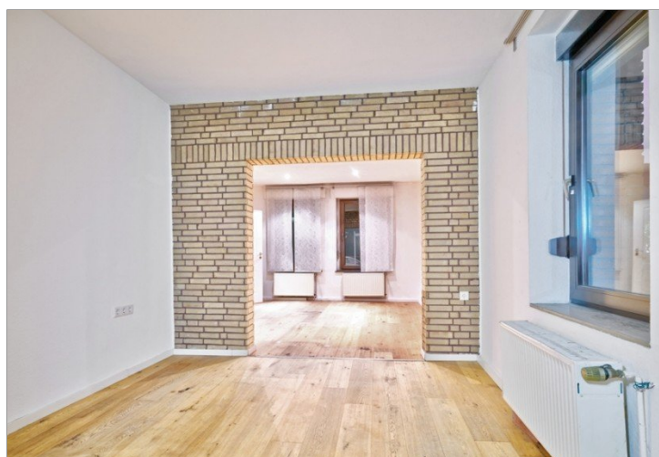
Essen EG links