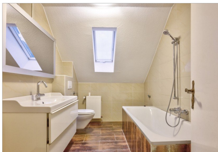
Tageslichtbad DG links