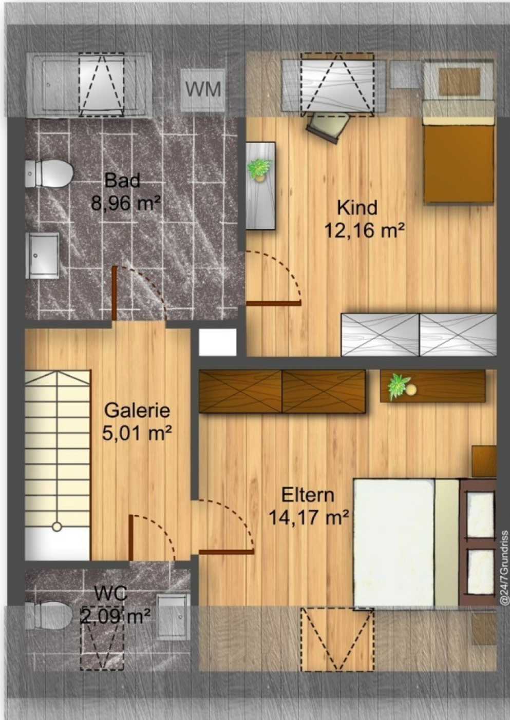
Grundriss Rechts DG