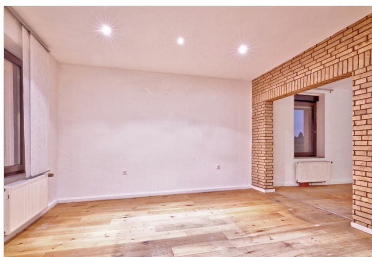
Wohnen EG links