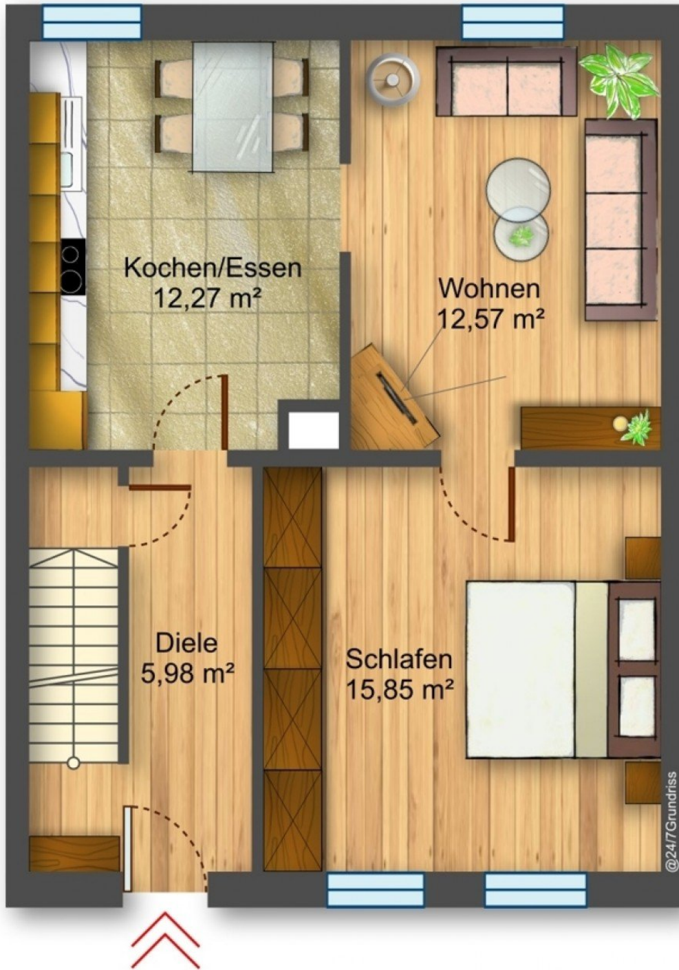
Grundriss Rechts EG