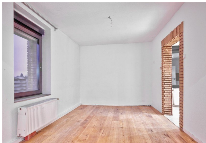
Essen EG links